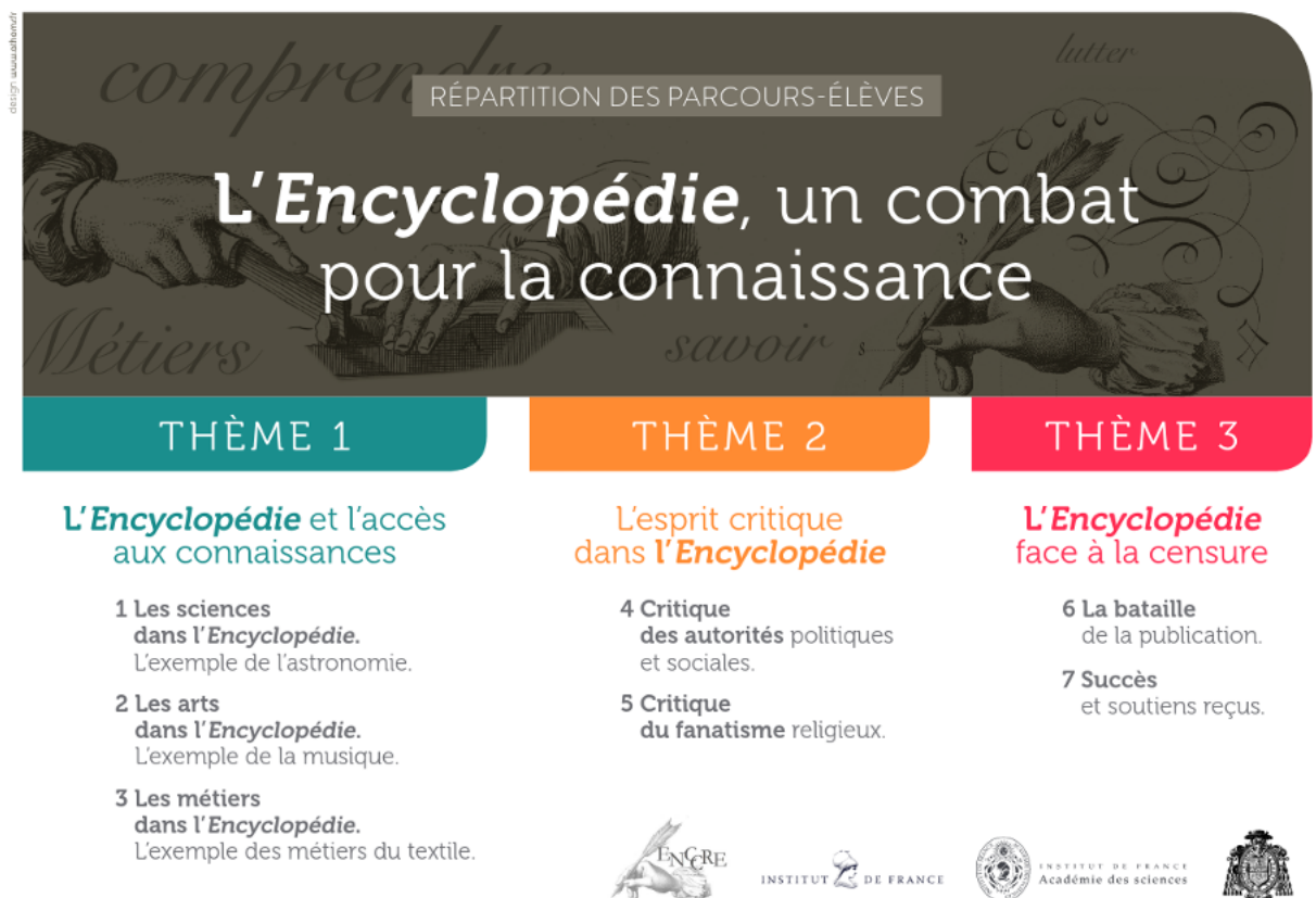
Figure 3 : Les parcours thématiques du dossier pédagogique de l'Institut de France

Le service des actions pédagogiques et culturelles de l'Institut de France propose également des visites-ateliers « L'Encyclopédie, un combat pour la connaissance » qui permettent d'accueillir des professeurs avec leurs classes. Des volumes de textes et de planches sont présentés aux élèves, qui en approfondiront l'analyse au cours d'un atelier numérique s'appuyant sur l'ENCCRE.