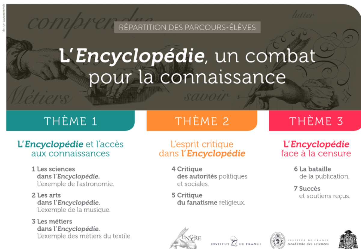
Figure 3 : Les parcours thématiques du dossier pédagogique de l'Institut de France

Le service des actions pédagogiques et culturelles de l'Institut de France propose également des visites-ateliers « L'Encyclopédie, un combat pour la connaissance » qui permettent d'accueillir des professeurs avec leurs classes. Des volumes de textes et de planches sont présentés aux élèves, qui en approfondiront l'analyse au cours d'un atelier numérique s'appuyant sur l'ENCCRE.